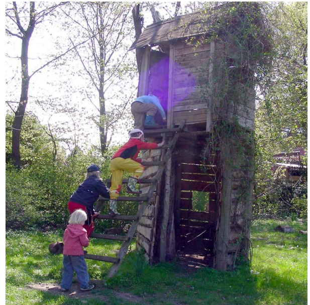
Hier gibt es ein tolles Baumhaus mit Balkon

Außerdem gibt es eine Hängematte, mit der kann man toll schaukeln.