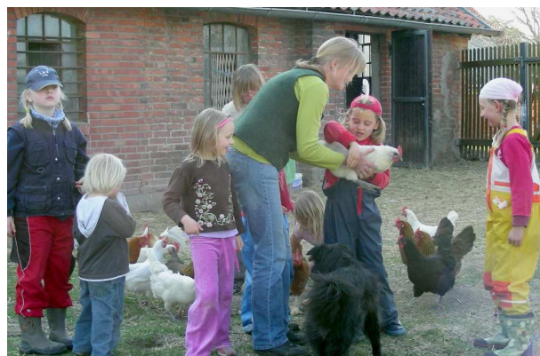
Die Hühner dürfen wir sogar hochheben

Im Hühnerstall haben die Hühner ganz, ganz viele Eier gelegt. Wir sammeln sie alle ein. Uns ist auch kein Ei kaputt gegangen!