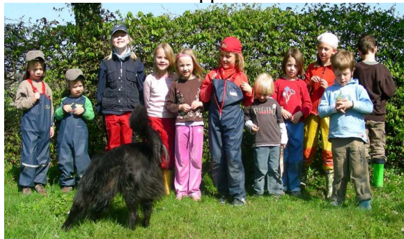
Die Waldwichtel mit Emma, der Hofhündin