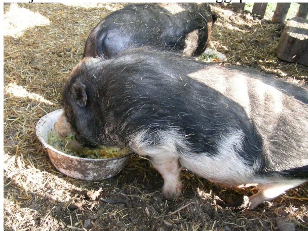
Die Hängebauchschweine haben alles weggeputzt

Zum Schluss sind wir bei den Schafen und zwei chinesischen Hängebauchschweinen . Die bekommen von uns leckeren übrig-gebliebenen Gemüse-Nudelauflauf. Das muss denen ganz schön lecker geschmeckt haben - auf jeden Fall haben sie alles weggeputzt.